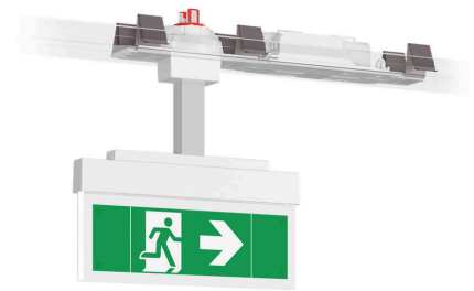
Abbildung zeigt Zubehör

Schlichte und moderne Rettungszeichenleuchte aus hochwertigem Aluminium für die Montage in dafür freigegebene Lichtband-Geräteträger. Über den eingebauten Rastmechanismus kann die Leuchte in 30°- bzw. 45°-Schritten um die eigene Achse gedreht werden. Gegen Aufpreis kann die Leuchte werkseitig fertig montiert in durch uns zugekaufte und bearbeitete Lichtband-Geräteträger bezogen werden (Details siehe nachfolgende Tabelle). Im Leuchtenpreis ist pro Leuchte ein Piktogramm-Vorsatzfolien-Set - Pfeil links/rechts/unten/oben/blind (Erkennungsweite 10 m) enthalten. Die 10 mm Lichtlenkscheibe wird mit einer 2 Watt LED-Leiste ausgeleuchtet. ACHTUNG! Die angegebene Schutzart bezieht sich auf die Leuchte (raumseitig) im eingebauten Zustand. Bei Einbau in einen Geräteträger mit abweichender Schutzart gilt die jeweils niedrigere Schutzart.